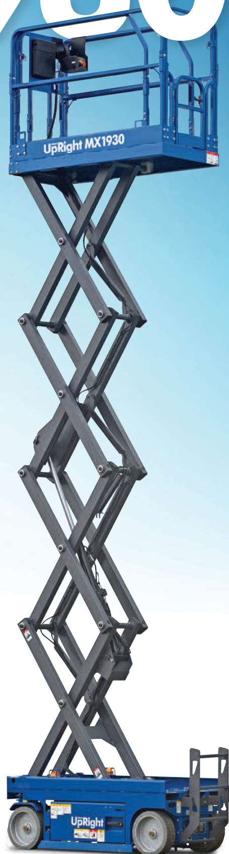
PLATE-FORME ÉLEVATRICE À CISEAUX AUTOMOTRICE ET ÉLECTRIQUE